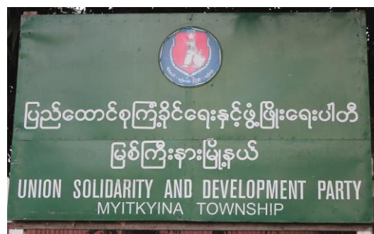
Regeringspartiet gjorde ett katastrofval

Aung San Suu Kyi har visserligen talat om federalism, utveckling i enlighet med "the spirit of Panglong" 3 och att hon skall ta ledningen i fredsprocessen, men etniska ledare väntar enligt uppgift ännu på konkreta förslag. Många av dem ser med blandade känslor fram mot att landet åter skall styras av ett bamar-dominerat parti, inte minst mot bakgrund av Aung San Suu Kyis försök att förbättra relationerna med Tatmadaws ledning. Hon har de senaste veckorna träffat presidenten, talmannen och överbefälhavaren Min Aung Hlaing privat och även den förre enväldshärskaren Than Shwe.