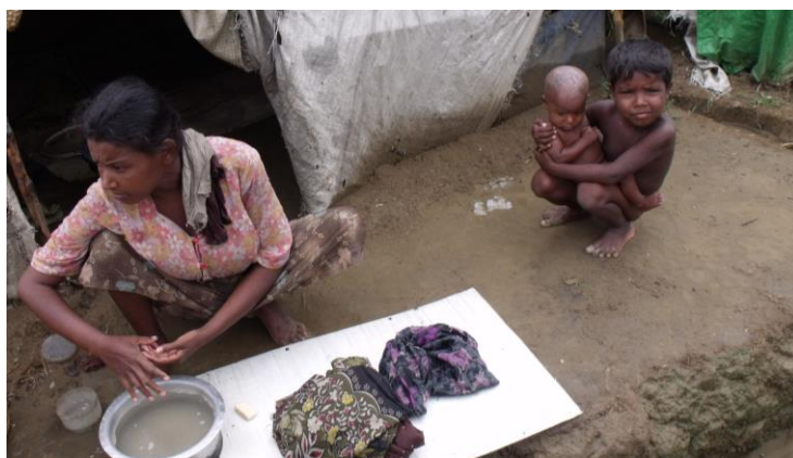
Minst 100 000 rohingyas hålls instängda i läger. Deras situation kommer bli ett bestående problem för den nya regeringen.

Burma har världens längsta kända övergångsperiod efter ett val. Inte förrän den 1 april 2016 tillträder den nya regeringen, nästan fem månader efter valet. Det innebär paradoxalt nog att i parlamentet pågår just nu en session där merparten av ledamöterna förlorat sina platser och inte kommer att vara med nästa mandatperiod. Och det parlamentet skall bl.a. godkänna budgeten för 2016!